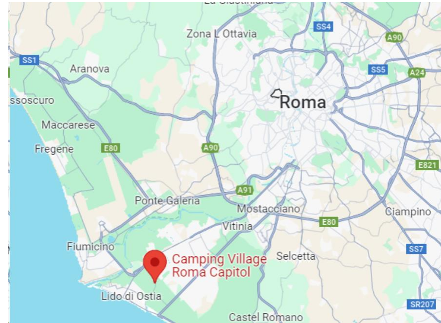
Kart hentet fra Google maps